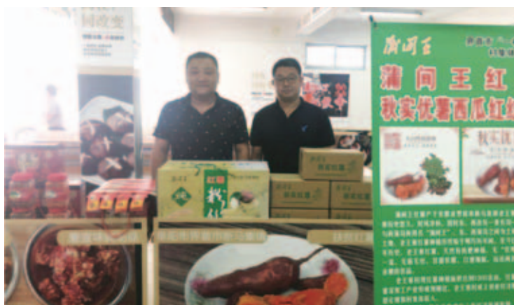
驻村工作队积极参加线上、线下各种农产品展销