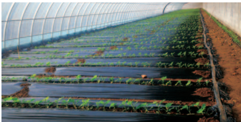
华润电力捐赠98万元帮助辽宁省葫芦岛市石洞子村建设7座高标准果蔬温室大棚，解决了20余名留守劳动力就业问题，项目部分利润用于贫困学生奖励、贫困人口慰问、建设美丽乡村

“授人以鱼，不如授人以渔”。形式多样的扶贫措施，要持久见效，要可持续发展归根结底要有成熟稳定的产业做支撑，华润电力通过深入挖掘贫困地区经济发展资源与地域特色，针对贫困地区产业基础薄弱的实际问题，将产业资本和贫困地区特色资源有机结合，实施创新销售模式，项目选择注重可持续性，培养特色化、集聚化、规模化扶贫产业，带动贫困人口参与产业、分享收益，确保稳定脱贫不返贫。