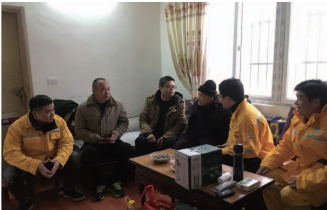
白鹭项目员工慰问周边青峰岭林场困难老党员

华润电力白鹭项目公司的厨师师傅介绍，在来华润电力上班之前，因为父母上了年纪，他不方便外出务工，所以家庭收入有限，是当地的贫困户。得知他家情况后，华润电力主动邀请他到公司上班，他感动地说：“这不仅解决了我照顾父母和工作不能兼顾的问题，而且工作之余我还在山里搞起了养殖，父母也能在家帮忙管理。而且之前家里养殖主要是圈养，上山就得跟着羊群满山跑，所以只养了几只。现在路修好了，可以骑摩托车上山放养，不仅减少草料的投资，也节省了很多体力，便于规模化管理，今年我养了100多只山羊，我们家呀已经不再是贫困户啦，这都得益于党的政策好啊！”