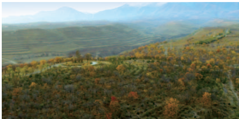
华润电力累计向宁夏海原捐赠2000万元用于生态公益林建设

贫困地区生产生活设施普遍落后，人居环境较差，华润电力积极支援地方民生基础设施建设，努力改善贫困群众生产生活条件，通过铺路、架桥、通电、安装路灯、绿化等等一系列举措，改善当地群众出行条件以及人居环境。