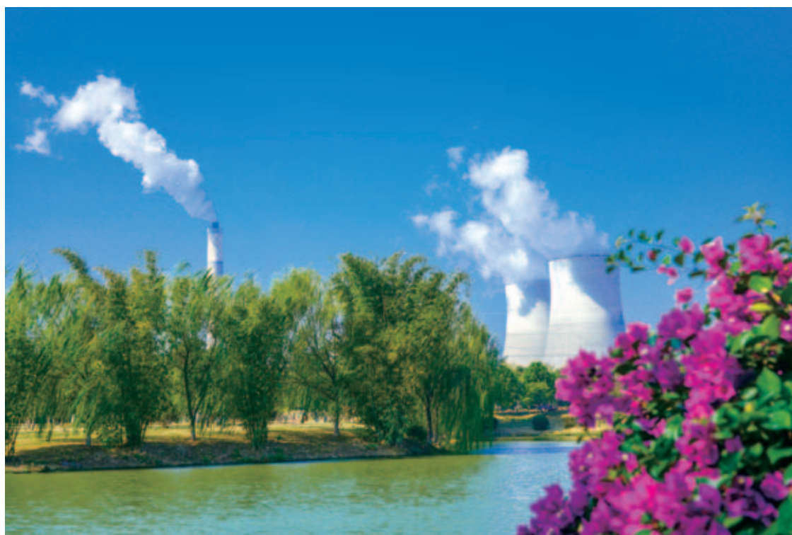
华润电力贺州电厂

华润集团充分发挥红色央企使命担当,助推瑶乡脱贫攻坚,在地处偏远、物流成本高昂的富川投资建设了广西首家百万火电机组——华润电力(贺州)有限公司(以下简称华润贺州电厂)。“十三五”期间,华润贺州电厂主动承担富川脱贫攻坚重任,通过打造贺州华润循环经济产业示范区,创新“贺电送粤”能源精准扶贫项目,援建华润小学,成立爱心扶贫基金资助贫困大学生,探索“公司+基地+贫困户”中草药种植扶贫模式,改善基础设施,建设贫困村养老院等一系列举措积极参与脱贫攻坚工作,在富川脱贫攻坚史上写下了浓墨重彩的一笔。2019年4月24日,富川成功实现脱贫摘帽。