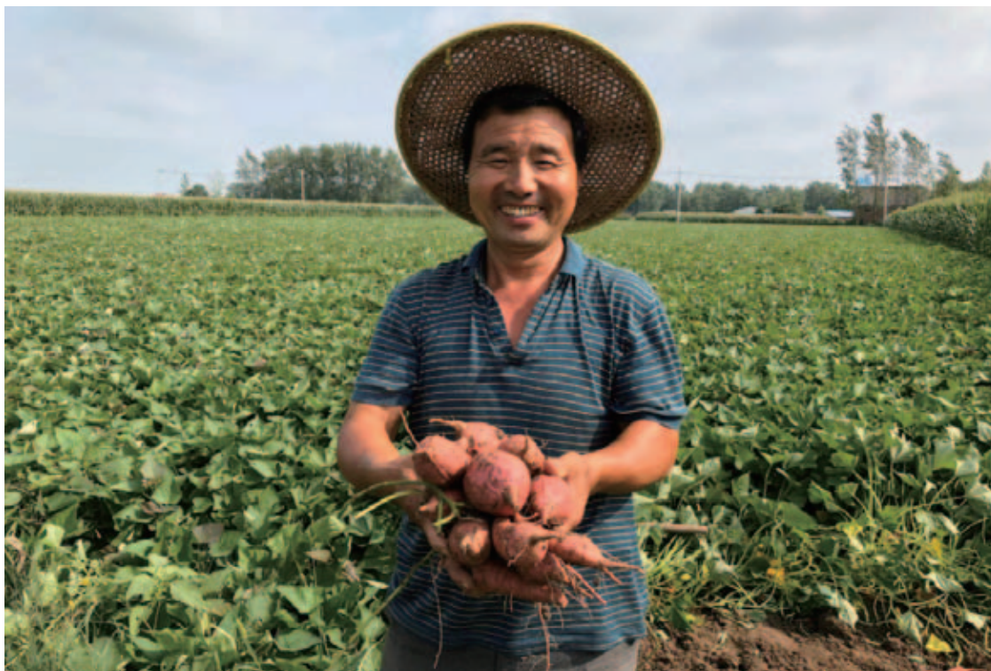
老王寨村当地农民因红薯大丰收难掩喜悦