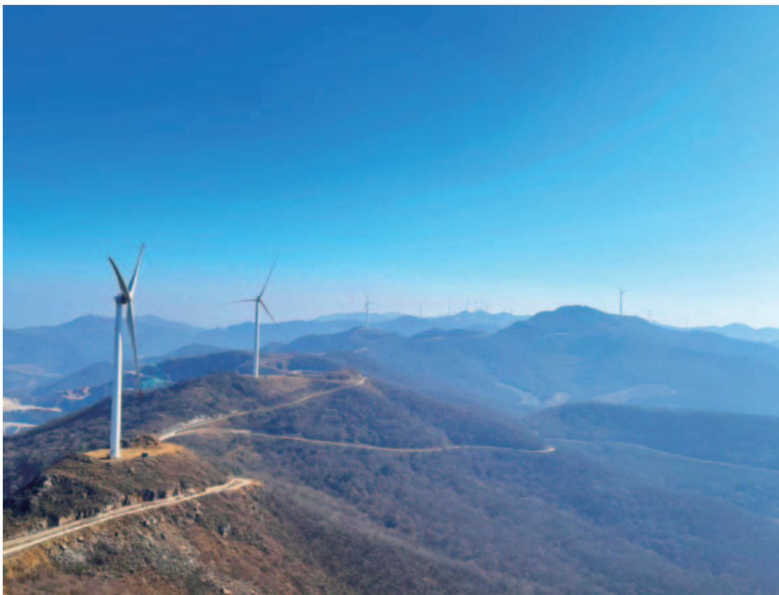
风机矩阵成为当地一道靓丽风景线