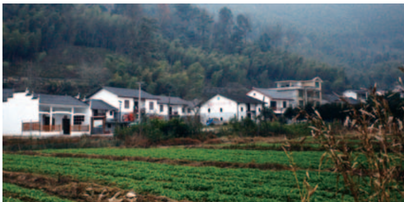
江西井冈山华润希望小镇是华润集团捐建的第7座希望小镇，华润电力向小镇捐赠安装88套太阳能路灯，向小镇上的百人大礼堂捐赠2套投影仪

华润电力积极参与华润集团在革命老区和贫困地区的希望小镇建设工作，希望小镇建设过程中，华润电力派驻专员参与支援相关项目建设，修建道路照明，完善基础设施；捐赠洒水车辆，改善卫生环境；结对帮扶贫困大学生，邀请学子走进电厂参观；开展“电力课堂”，捐建学习用品，用实际行动投入到社会主义新农村建设过程之中，践行华润电力社会责任。