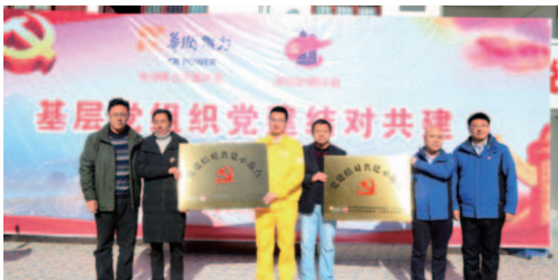
基层党组织党建结对共建

公司各基层企业积极加强党的建设，发挥党的政治优势、组织优势以及密切联系群众优势，聚焦提升基层党组织的协调能力，把党建优势转化为扶贫优势，将组织活力转化为攻坚动力，汇聚起万众一心抓脱贫的强大动能，打出党建、扶贫联合推进“组合拳”。