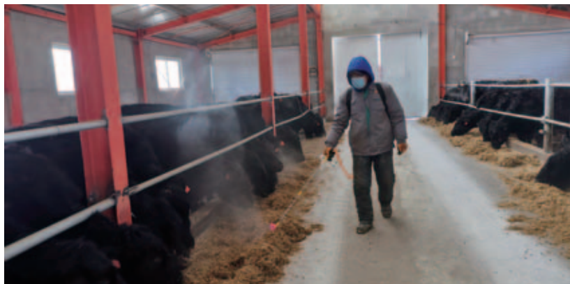
华润电力向内蒙古自治区锡林郭勒盟太仆寺旗捐赠1亿元人民币，定向帮扶太仆寺旗肉牛精深加工、肉牛繁育、肉牛育肥产业发展，该项目还可直接吸纳当地160位农牧民就业，间接带动相关产业就业100人

增加就业是最有效最直接的脱贫方式。做好就业扶贫工作，促进农村贫困劳动力就业，是脱贫攻坚的重大措施。华润电力通过公益项目和上下游产业链，积极吸收周边贫困群众参与到工程建设中来，增加贫困人口经济收入，造福当地百姓。