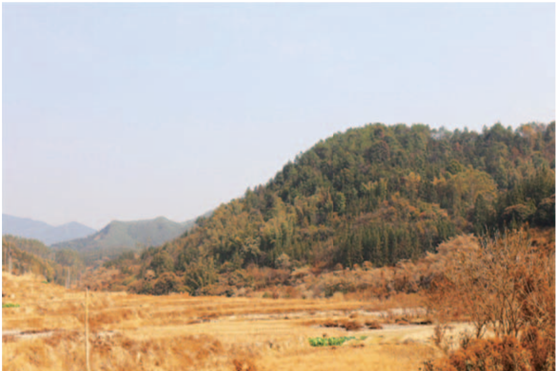
广东省“金三角”的“寒极”清远市