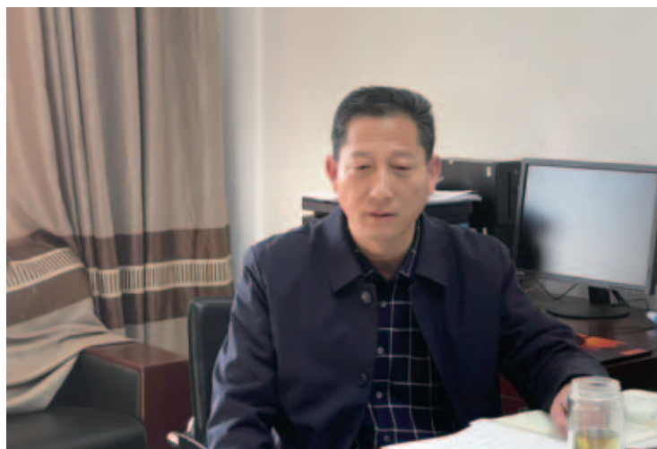
枣阳扶贫办主任“数说”风电扶贫

扶贫办张主任列举了一组数据，直观地展现了华润电力为当地脱贫攻坚作出的贡献——枣阳市政府统筹专项扶贫资金入股华润电力，占30%股份，2017年实现分红172.32万元，当年54个贫困村每村分红3.19万；2018年分红是290.29万，77个贫困村每村分红3.77万；2019年分红达到476万元，77个贫困村中（72个村，每村分红