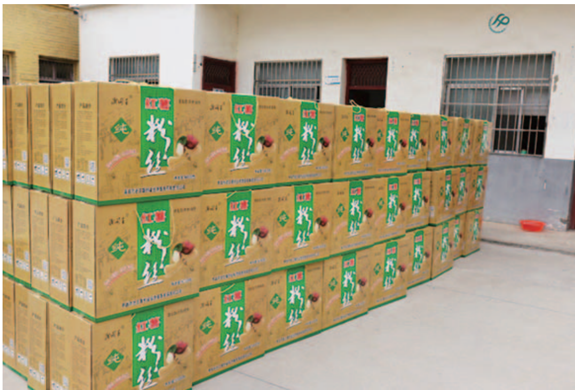
村里成立红薯种植专业合作社，一箱箱打包好的产品整装待发

其中最引人瞩目的是红薯特色产业的发展。在阜阳电厂驻村工作队和村两委通力配合之下，因地制宜地为老王寨村选择了红薯种植、储存、深加工、销售为一体的产业精准扶贫模式，成功帮助210户贫困户，566人脱贫。