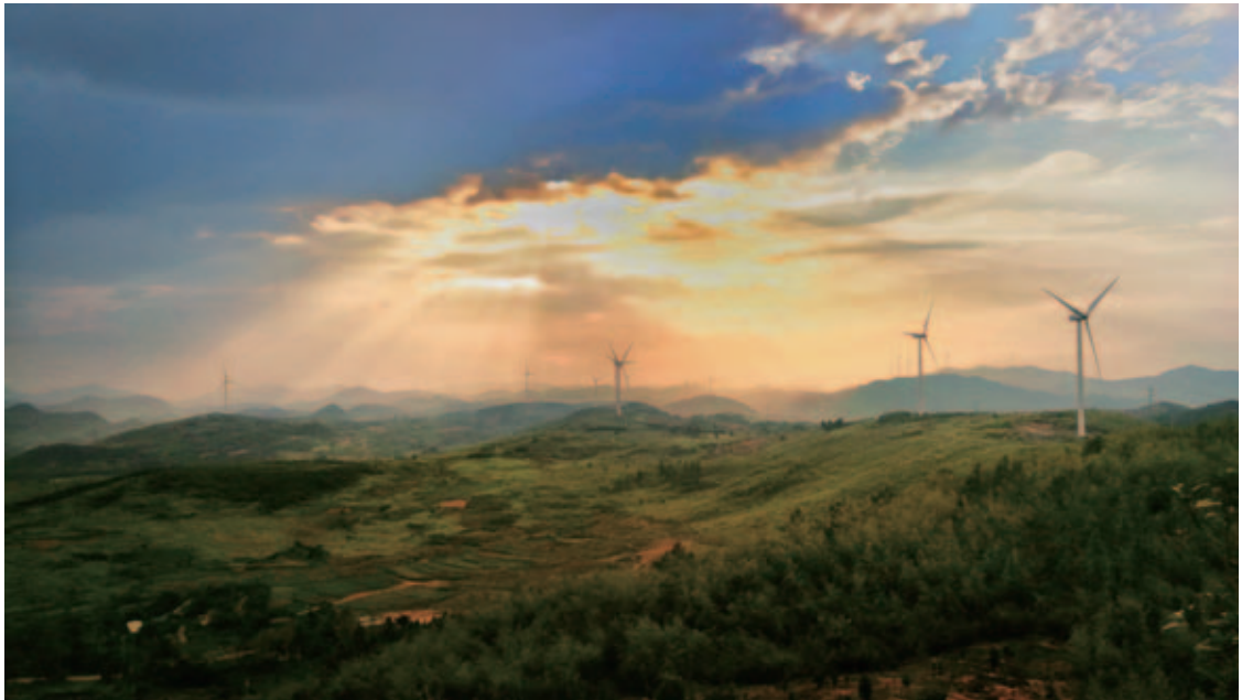
华润电力连州慧光风电项目

此外，近年来随着当地生活水平的提高，到风景秀丽的山区旅游成了大家休闲娱乐的一种方式，但是山路崎岖、道路难行成为制约当地旅游业发展的瓶颈。风电项目落地后，华润电力开展了修路、架桥、通电、架设路灯、植被恢复等工作，为开启当地旅游业创造了必备条件，周边村庄百姓也顺势开起了餐饮、住宿、休闲、娱乐的农家乐，激发了当地百姓脱贫致富的内生动力。