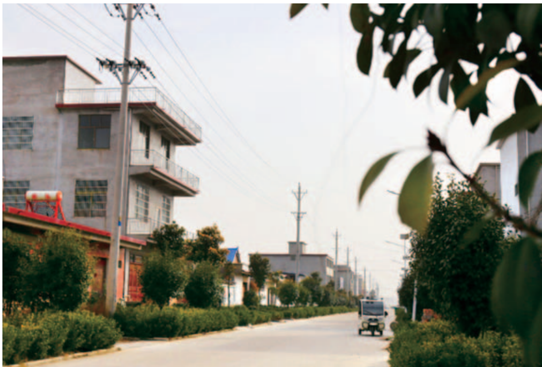
老王寨村旧貌换新颜